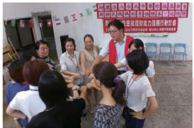
每一期課程，帶領人都是從幸福約定開始，與學員約定一起為圓夢而努力。