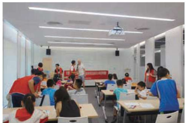
7月4日舉辦為期5天英語育樂營，輕鬆活潑的課程內容，讓孩子們從自我介紹開始進入英文學習。