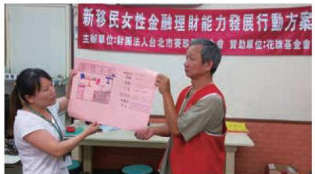
學員利用學習之理財知識，做出長期的財務規畫，築夢踏實。

生命的小船在浩瀚的大海中航行，當名為夢想的風帆揚起，不論在何時展開又在何地啟航，只要開始行動，就是踏上通往幸福之地的捷徑。希望本會能讓更多姊妹準備好夢想的風帆，從「幸福帳本」帶著希望啟航，一起在夢想的航道上努力。