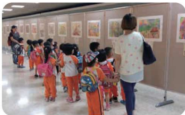
11月15日至19日，2016新移民子女創作比賽得獎作品於國立科學工藝博物館展出。