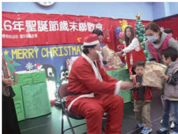
孩子們開心的從聖誕老人手中領取禮物。