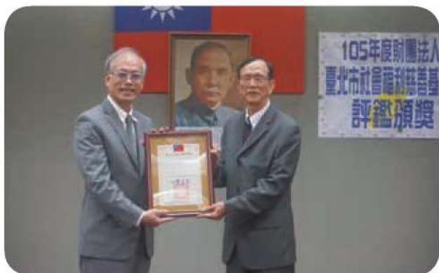
12月9日，本會榮獲105年度財團法人臺北市社會福利慈善基金會評鑑甲等。