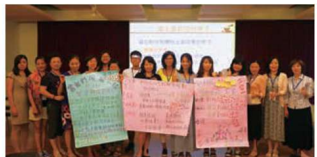
集結新移民姊妹建議，我們提出首版參與式預算。

生活歷程不也是如此嗎? 我想,我們的社會正是需要匯集這樣暖心的力量與熱情的行動~從你我身邊小小的地方著手、共同營造、努力,就可以成就大大的幸福!