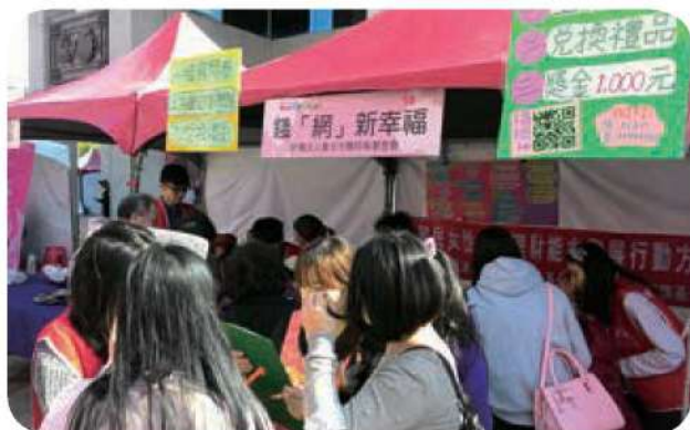
12月17日於移民節設攤推廣理財教育，當天超過500人參與同樂。