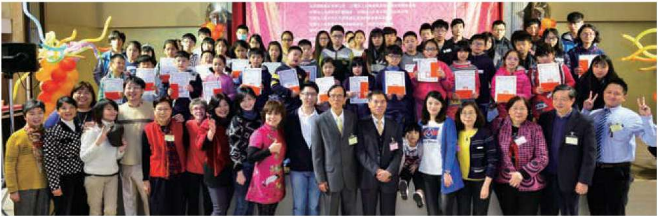
獎助學金獲獎同學與貴賓開心合影，紀錄這溫馨的一刻。