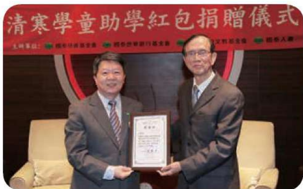
2017年1月10日國泰人壽慈善基金會捐贈清寒學童助學紅包，本會回贈感謝狀以表謝忱。