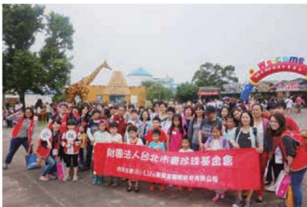
5月21日本會社工帶著新移民家庭造訪六福村，大小朋友同樂。

尤其在這歲末圍爐的時刻，我們舉辦第11屆的「2017童心協力-弱勢新移民家庭新春圍爐活動」，感恩大眾對弱勢族群的關懷始終不斷，讓我們可以邀請本會扶助的兒童及其家人共同參與，將募集來的善款用於圍爐活動餐費、助學紅包，以及2017年助學服務經費，陪伴孩子們一步步自立，讓我們的下一代可以在穩定的環境中勤奮向學，為自己、為台灣開創美好的未來！