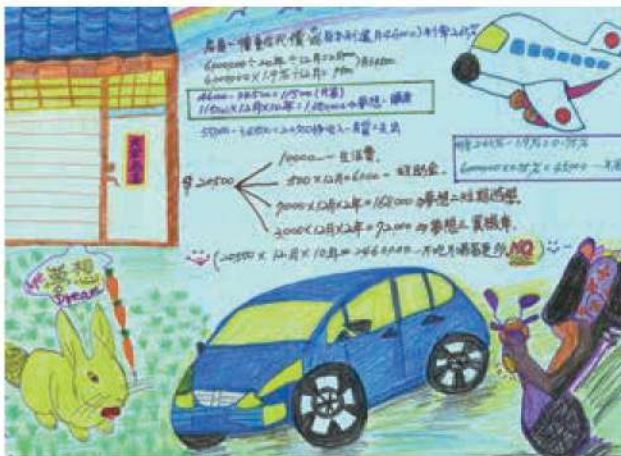
原本遭逢意外陷入經濟困境的學員，參與幸福帳本課程後，不僅會理財，還懂得理債。

「我的夢想是買行動餐車，讓台灣人都吃到來自我家鄉越南的美食。」「我的夢想是兩年後可以回印尼探親。」「我的夢想是存到小孩出國留學的基金。」「我的夢想是回越南買房子給爸爸媽媽。」「我的夢想是開一間美甲工作室。」從2012年至今，新移民媽媽的幸福帳本已開辦到了第五十期課程，這裡，成為新移民姊妹們勇於築夢的幸福新起點。