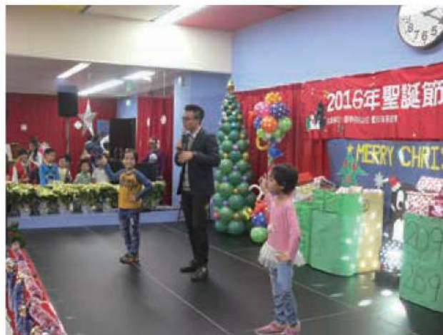
孩子們隨著小蘋果輕快的節奏跳舞。