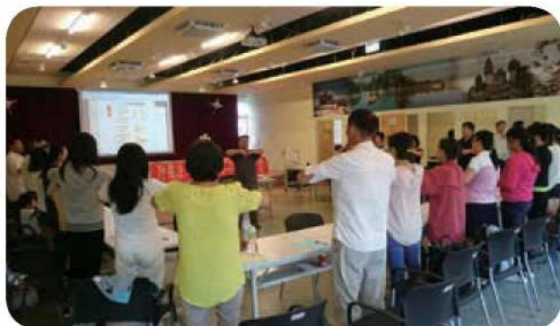
10月29日假萬華新移民會館辦理親職講座，學員在課堂中練習舒展運動。