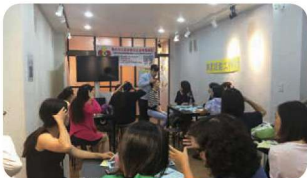
10月22日辦理職業探索工作坊，讓新移民姊妹透過實際操作了解經絡師的工作。